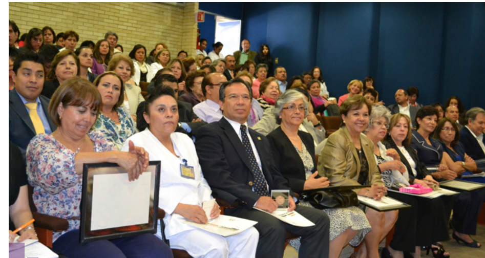
Profesores galardonados durante la ceremonia.

informar, de transferir datos y argumentos. El verdadero maestro contagia interés por su campo, invita a la exploración adicional, abre caminos para el desarrollo integral de su discípulo, convoca con la palabra y el ejemplo a la superación constante.