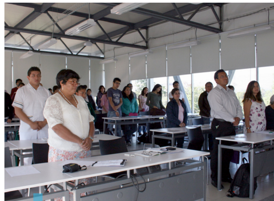
Presencia de alumnos y docentes en el evento.